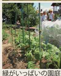
緑がいっぱいの園庭