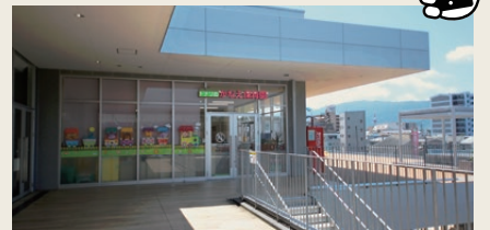
トナリのかなえ保育園